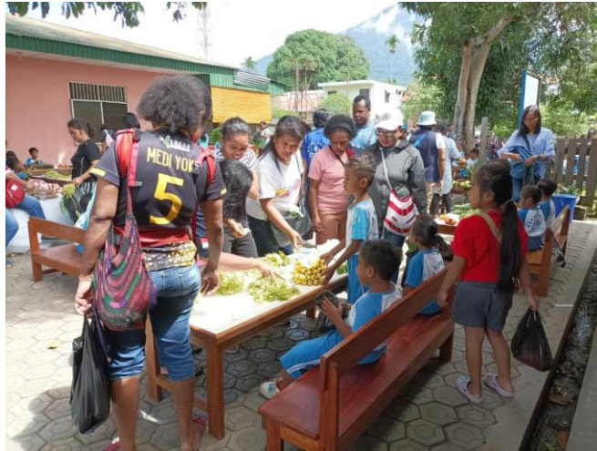
Markt op schoolplein door de leerlingen voor ouders en familie etc.