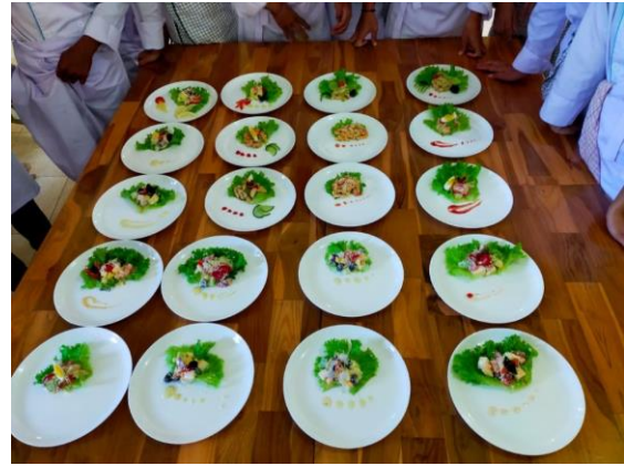
Resultaat praktikum lessen middelbare hotelsschool afdeling horeca