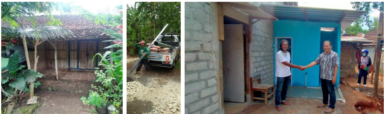
Huis van een bewoner, aankomst bouw materiaal en zijn nieuwe WC

Gekozen wordt deze bouw in het dorp Bejiharjo - Karangmojo , kabupaten Gunung Kidul te starten waarbij in eerste instantie bij 6 gezinnen een toilet zou worden gerealiseerd. Het bouw materiaal en de hulp van 2 bouwvakkers zouden door Stichting OBEL worden gefinancierd, waarbij de eigenaren van het huis meehelpten bij de bouw met o.a het graafwerk en transport/ sjouwwerk van de bouwmaterialen. Hierdoor zijn binnen min of meer 3 maanden deze 6 toiletten gebouwd.