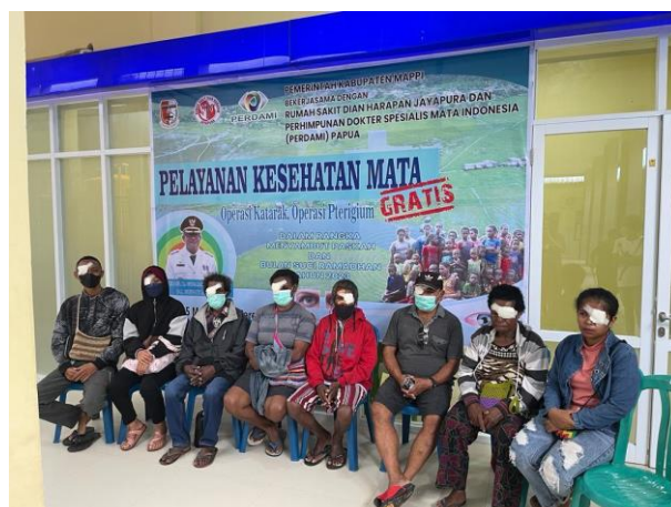
Mappi, enkele geopereerde katarakt patienten

Hier zijn alle kosten door de lokale overheid betaald.