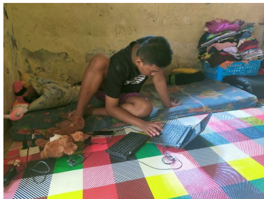
Een leerling voor zijn middelbare beroepsopleiding school en thuis aan het werk