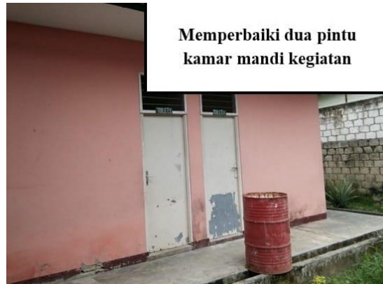
Memperbaiki dua pintu kamar mandi kegiatan

Door vocht beschadigd plafond, muren en deuren