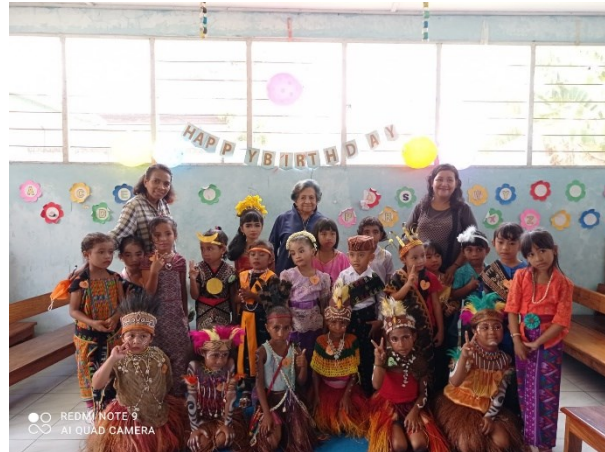
Viering 14 jaar PAUD (preschool onderwijs)