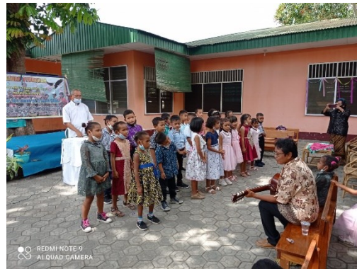
Viering 14 jaar PAUD (preschool onderwijs)

Om de continuïteit van dit onderwijsproject te waarborgen heeft eind 2021 mevr. Rosa die dit project leidt, een verzoek ingediend t.b.v. een “onderhoudsbeurt” van de gebouwen (leslokalen, keuken, toiletten etc.). Tevens voor een computer ter ondersteuning van het onderwijs, mede vanwege het feit dat er ook veel online les wordt gegeven.