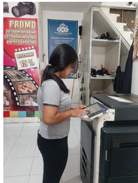
Stage foto student food and catering en student multimedia richting